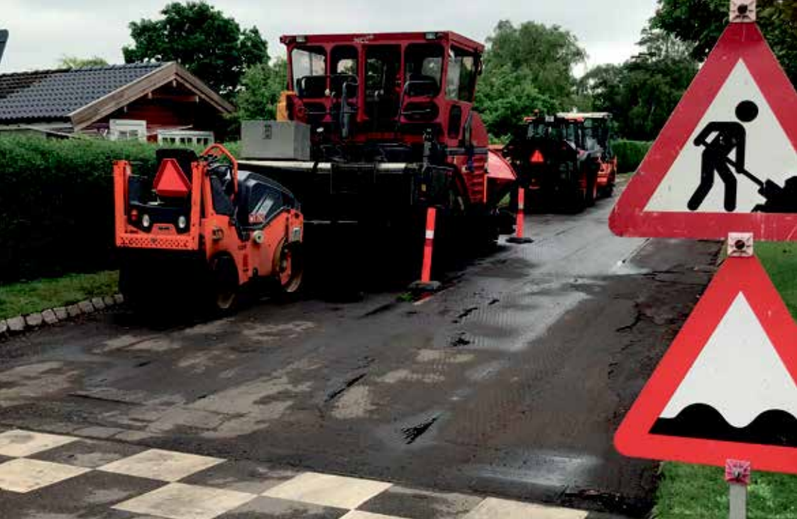
Tværevej får ny belægning

rabatterne. iflg. vore vedtægter skal man have plads til 2 biler i sin indkørsel, og der bør man parkere sin(e) biler, så man undgår at græsset på rabatten bliver kørt op, og området ikke ser særlig pænt ud. Nogen vælger at opsætte snore for at undgå, at der parkeres på deres rabat. Det er helt ok i en periode, hvor der pågår ombygning/nybygning, men efterfølgende skal de fjernes, så man kan færdes trygt på rabatten uden at falde og brække en knogle. Nogen vælger også at lægge sten, det er kun tilladt, hvis man har fået tilladelse hertil af vejudvalget.